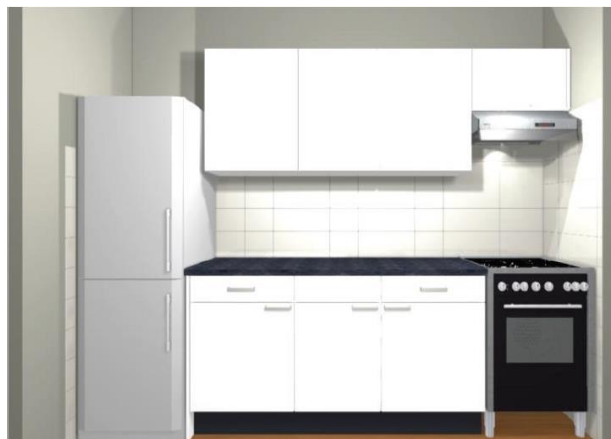
Voorbeeld van de keuken (de oven, koelkast, en circulatiekap met kastje erboven zitten er niet bij)

Als u één van onze woningen gaat huren, kunt u, als een standaard service waarvoor u niets extra's betaalt, enkele keuzes maken. Zo kiest u uit een aantal opties voor: